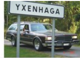
Ankunft in No-where-city