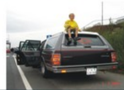
Auf die Fähre in Travemünde